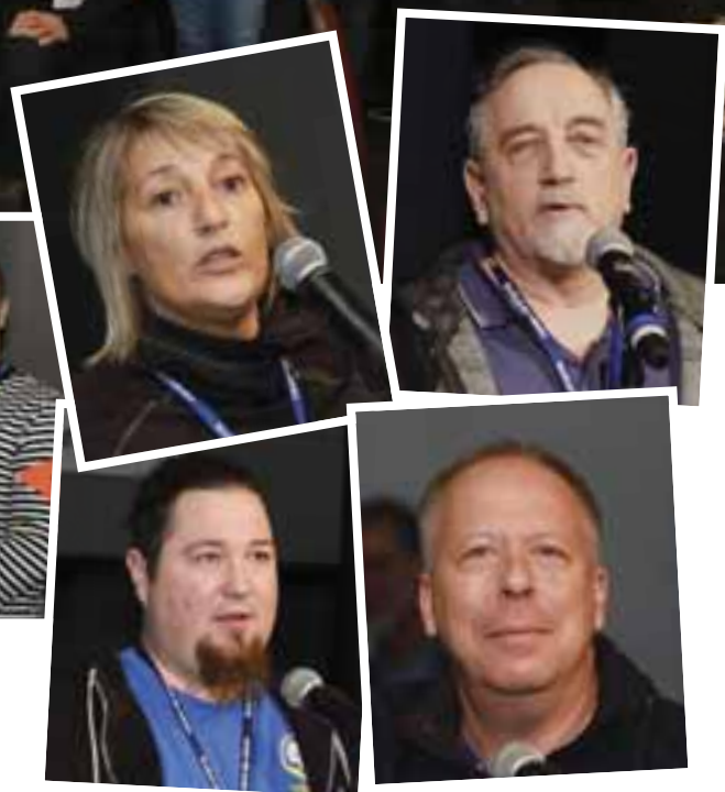
Voici la délégation du 8922 qui était présente à l'Assemblée annuelle des Métallos qui s'est tenue en novembre.